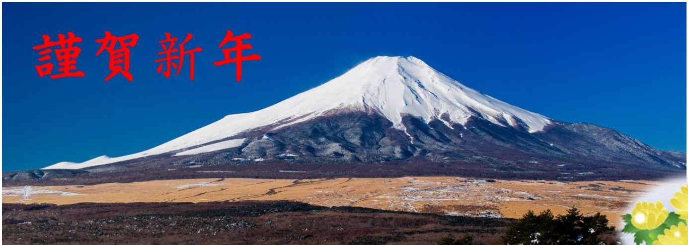
山中湖北岸より富士を望む