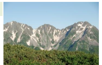
右に檜ヶ岳、左端に南岳の稜線