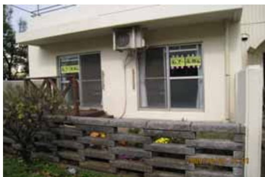
南瀬谷高齢者支援拠点

拠点には2名が常駐しておられ、1名は瀬谷区社会福祉協議会職員、他の1名は地域の「運営協力者」（現在9名）で、1日（10時～17時）2交代制で日々の生活支援、移動サポートなどの相談を受けています。また約60名の方が「担い手協力者（ボランティアバンクえんの協力者と同じ）」として活動を支えております。