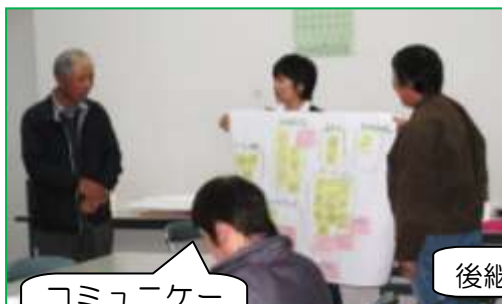
コミュニケーションは？