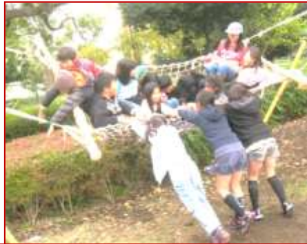
今度は大きい子だけで力いっぱい