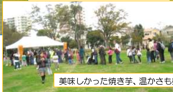
美味しかった焼き芋、温かさも嬉しかった