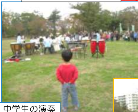
中学生の演奏に憧れる？

11 月 9 日の俣野公園でのスナップです。多くの笑顔・音楽・人の輪があふれた一日。子どもも大人もゆったりと楽しみ、輝いていました。