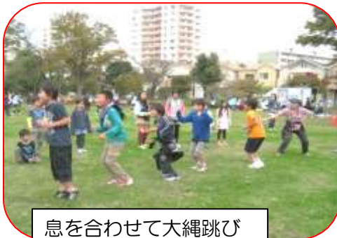
息を合わせて大縄跳び

地域運営協議会では今、これから先の地域を考えて、子どもや若者をテーマに話しあっています。子どもの居場所を、異世代との交流の場を、子ども達の学ぶ環境を・・・具体例もあがっています。