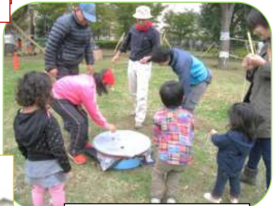
ベーゴマを競う老若男女

11 月 9 日の俣野公園でのスナップです。多くの笑顔・音楽・人の輪があふれた一日。子どもも大人もゆったりと楽しみ、輝いていました。