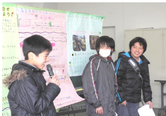
発表する深谷台小学校卒業生に大きな拍手が